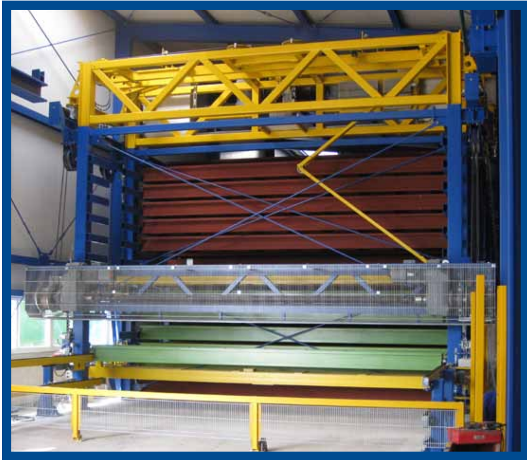
Referenzarbeiten Hochregallager | Tragrahmen u. Systemspindel-treppe | Lagerhalle | Treppenturm